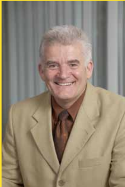
Bürgermeister Gunter Kastler