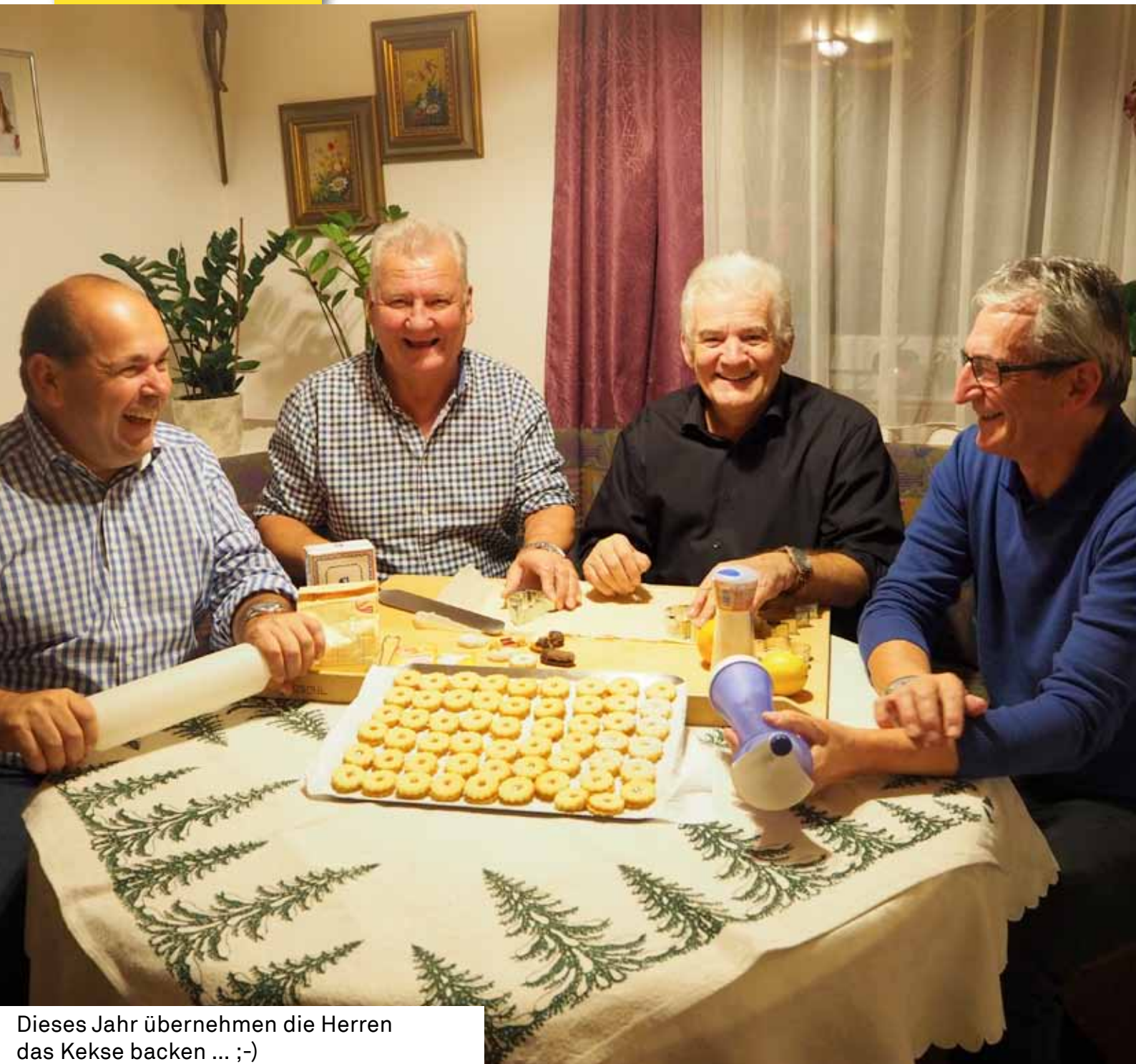
Dieses Jahr übernehmen die Herren das Kekse backen ... ;-)

Ein besinnliches Weihnachtsfest und alles Gute für 2017 wünscht die ÖVP Hörsching