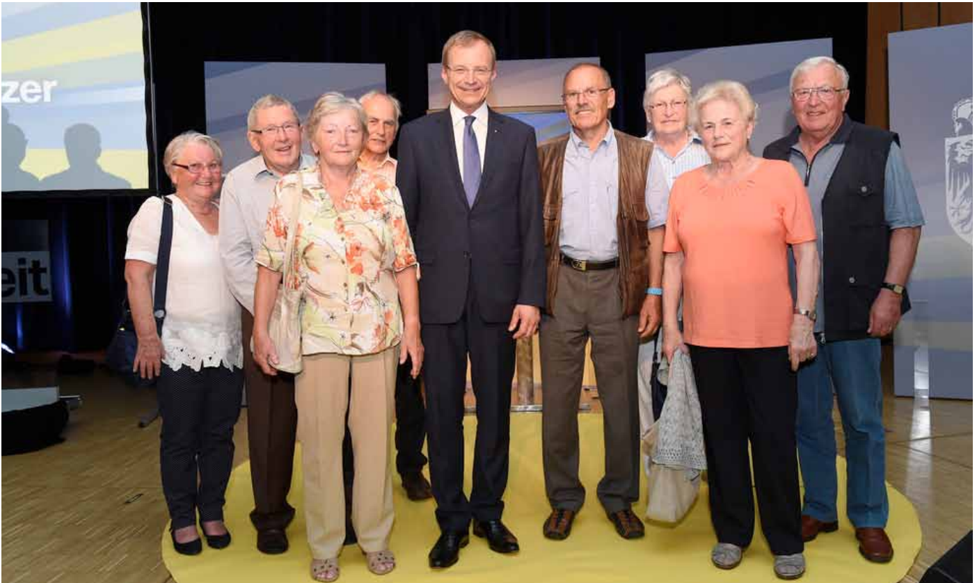
Besuch unseres Landeshauptmannes in Hörsching - wir waren dabei

Für das nächste Jahr ist unter anderem eine komfortable Schifffahrt auf der Mosel geplant, auch die Insel Mainau mit ihren herrlichen Gärten wird uns locken.