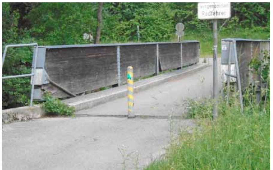
Vorher-Nachher Bilder der Brücke

geben. Diese Arbeiten wurden von der Firma Duschek und Duschek durchgeführt, die bereits die Fiberglas-Brücke beim Rutzingersee errichtet hat.