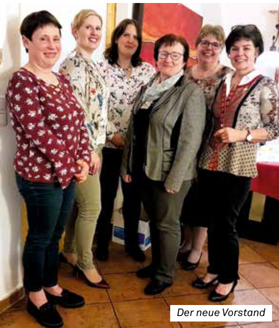
Der neue Vorstand