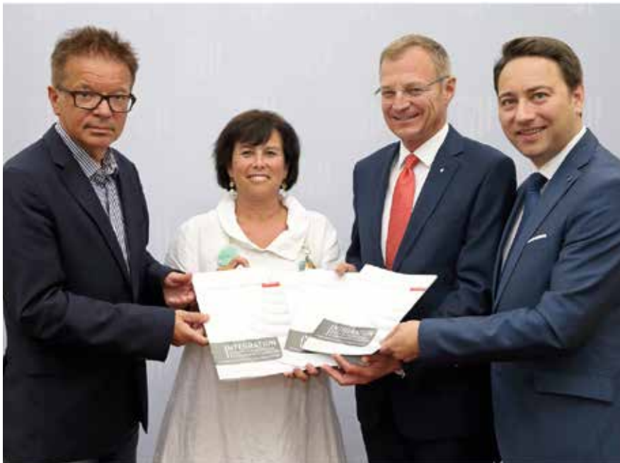
Das Oö. Integrationsleitbild wird von allen vier Parteien im Landtag mitgetragen.

Oberösterreich bekommt ein neues Integrationsleitbild. „Es geht darum, klar und deutlich zu vermitteln, wie wir uns das gemeinsame Leben in unserer Heimat vorstellen. Denn wer das Zusammenleben in unserem Land erhalten will, darf bei der Integration nicht nachlässig sein“, betont Landeshauptmann Thomas Stelzer.