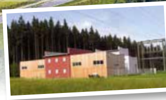
Geplanter Standort Umspannwerk EnergieAG