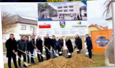
Baubeginn des neuen Hörchinger Rathauses im Frühjahr Seite 4