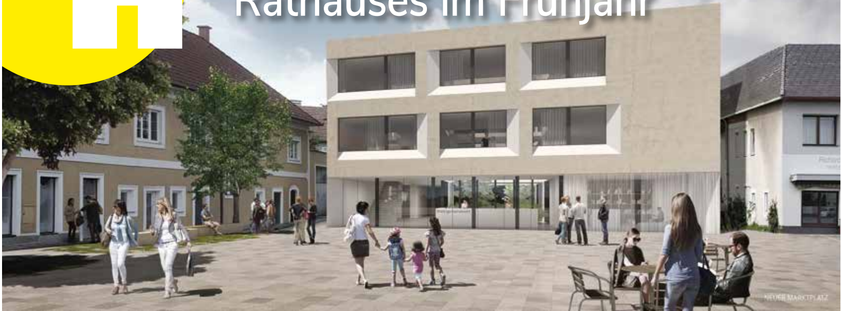
Ansicht Rathaus

Endlich ist es soweit. Im Frühjahr ist der Baubeginn des neuen Hörschinger Rathauses am Ortsplatz auf dem ehemaligen „Öhlingergrund“. Dem voraus gegangen ist ein geladener Architektenwettbewerb, welchen das Büro DI HERTL ARCHITEKTEN aus Steyr für sich entscheiden konnte. Die Entscheidung dazu fiel durch eine mit allen Fraktionen besetzte Jury.