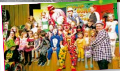
23. Hörchinger Kinderfasching Seite 6 HÖKiFA