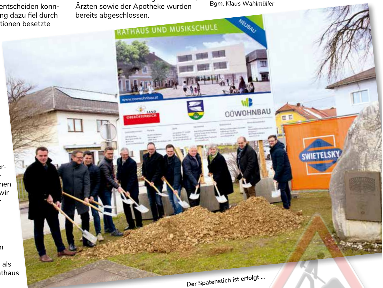
Der Spatenstich ist erfolgt ...