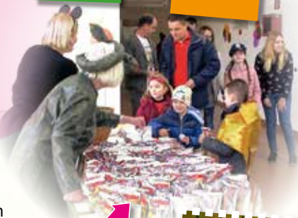
Eine kleine Erfrischung zwischendurch.