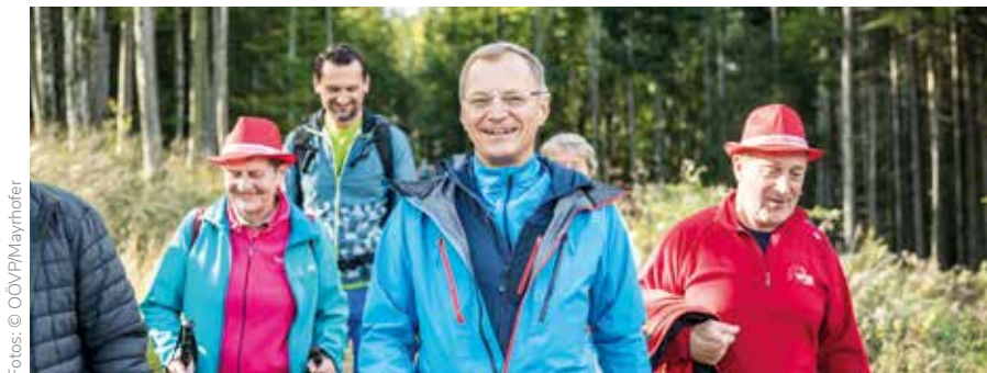
Landeshauptmann Thomas Stelzer hat einen klaren Kurs für ein starkes Oberösterreich. Kraft tankt er im Sommer beim Wandern in den Bergen.

Natürlich hoffe ich, dass viele Leute im Herbst sagen werden: Die OÖVP und der Landeshauptmann haben uns gut und sicher durch die Krise gebracht. Man wirbt bei einer Wahl vor allen auch um das Vertrauen der Menschen für die Zukunft. Ich habe klare Vorstellungen von der Zukunft, in die ich unser Land führen möchte: Wir wollen gemeinsam alles tun, um Oberösterreich wieder stark zu machen – wirtschaftlich und gesellschaftlich. Wir wollen Betriebe und Arbeit stützen und das bunte Netzwerk der Ehrenamtlichkeit wieder zum Blühen bringen.