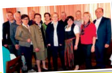
Der Seniorenbund Hörching hat sich neu aufgestellt Seite 9