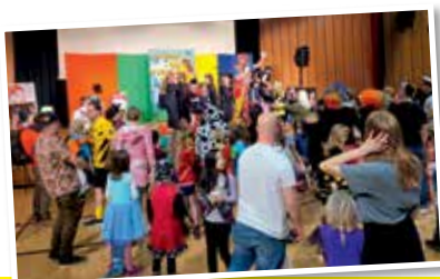
Wieder Riesenstimmung beim 24. Hörchinger Kinderfasching „HÖKIFA“ Seiten 4 u. 5