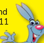
... die Seite für unsere jüngeren Leserinnen und Leser Seite 11